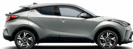
1L0 Prémium ezüst különleges fényezés 200 000 Ft Elérhető a Comfort, Style, Executive, Executive VIP felszereltségeken