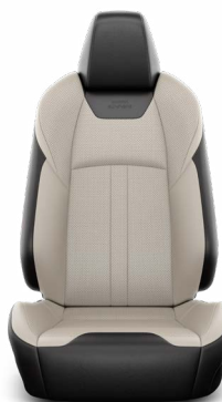
Grézs színű bőr kárpit Széria az Executive VIP modellváltozaton