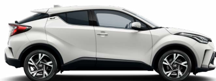
040 Hófehér felár nélkül Elérhető a Comfort felszereltségen