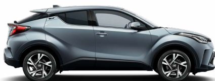
1K3 Szürkéskék metálfényezés 200 000 Ft Elérhető a Comfort és Style felszereltségeknél