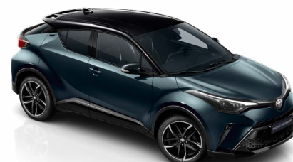
2YB Sötét zöldeskék / 785 fekete tetővel metálfényezés csak a GR Sport változatban rendelhető