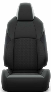
Fekete szövetkárpit, világosszürke varrással Széria a Comfort modellváltozaton