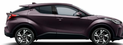
9AH Mély ametisztlila metálfényezés 200 000 Ft Elérhető a Comfort, Style, Executive, Executive VIP felszereltségeken