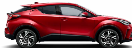
3U5 Érzéki vörös különleges fényezés 300 000 Ft Elérhető a Comfort és Style felszereltségeknél