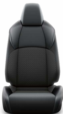
Fekete & sötétszürke szövet ülésborítás bőr betétekkel Széria a Style modellváltozaton