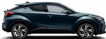
785 Sötét zöldeskék metálfényezés 200 000 Ft Elérhető a Comfort, Style, Executive, Executive VIP felszereltségeken