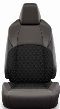
Orchidea-mintás steppelt szövetkárpit, bőr betétekkel Széria az Executive modellváltozaton