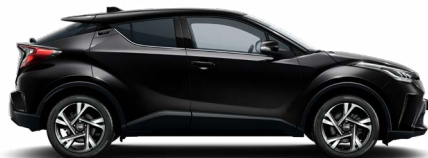
209 Éjfelete metálfényezés 200 000 Ft Elérhető a Comfort, Style, Executive, Executive VIP felszereltségeken