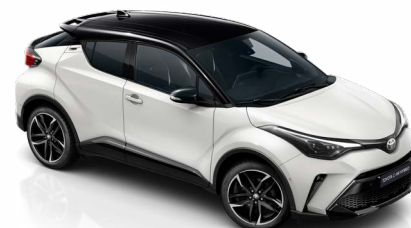
2MQ Hófehér / fekete tető csak a GR SPORT változatban rendelhető