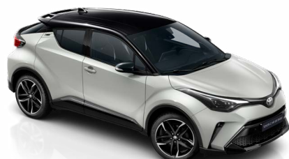
2VF Nikkelszürke / fekete tető metálfényezés csak a GR SPORT változatban rendelhető