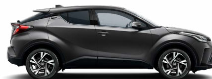
1G3 Hamuszürke metálfényezés 200 000 Ft Elérhető a Comfort, Style, Executive és Executive VIP felszereltségeknél