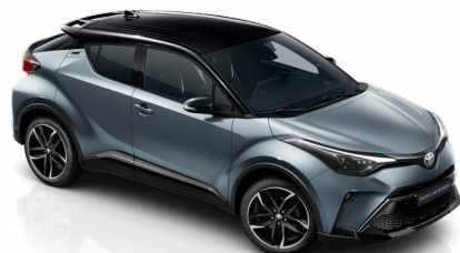
2TH Szürkéskék / fekete tető metálfényezés csak a GR SPORT változatban rendelhető