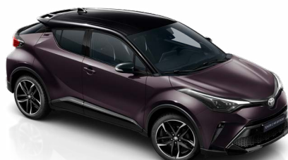
2XE Mély ametisztlila / fekete tető metálfényezés 200 000 Ft Elérhető a készlet erejéig!