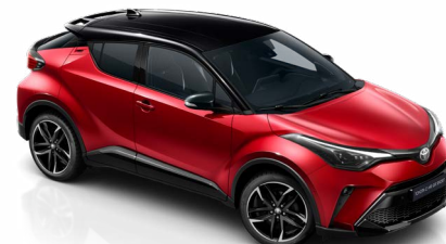
2TB Érzéki vörös / fekete tető különleges fényezés csak a GR SPORT változatban rendelhető