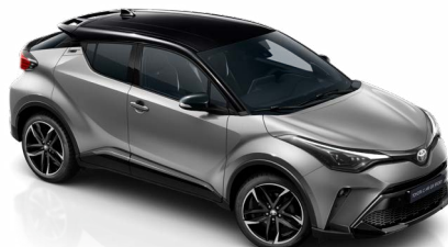
2VU Prémiumezüst / fekete tető különleges fényezés csak a GR SPORT változatban rendelhető