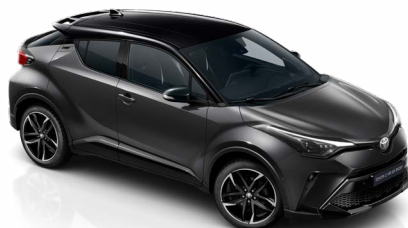
2NB Hamuszürke / fekete tető metálfényezés csak a GR SPORT változatban rendelhető