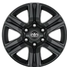
17" sötétszürke könnyűfém keréktárcsa (6 küllős) Alapfelszereltség az Active modellváltozaton