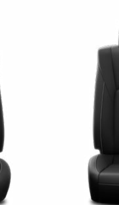
Fekete bőr Alapfelszereltség az Executive Leather modellváltozaton