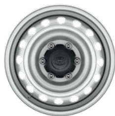
17" ezüst színű acél keréktárcsa Alapfelszereltség a Live szimplakabinos modellváltozaton