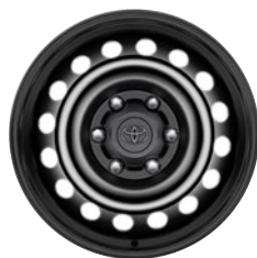
17" fekete acél keréktárcsa Alapfelszereltség a Live extra- és duplakabinos modellváltozaton