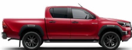
3T6 Lávavörös Metálfényezés nettó 255 000 Ft bruttó 323 850 Ft