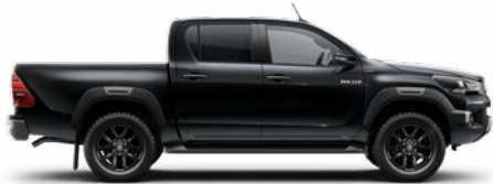
218 Fekete gyöngyház Metálfényezés nettó 255 000 Ft bruttó 323 850 Ft