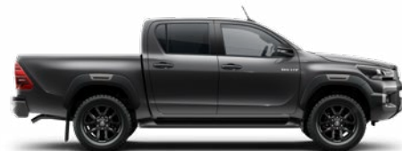
1G3 Hamuszürke Metálfényezés nettó 255 000 Ft bruttó 323 850 Ft