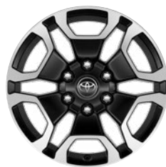
18" fekete, csiszolt felületű könnyűfém keréktárcsa (6 küllős) Alapfelszereltség az Executive modellváltozaton