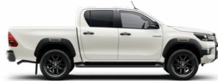
089 Gyöngyfehér* Metálfényezés nettó 310 000 Ft bruttó 393 700 Ft