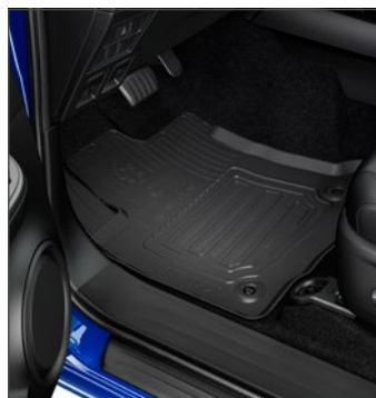
Gumiszőnyeg 39 200 Ft