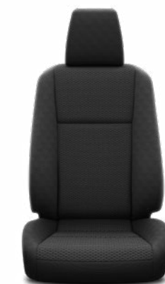
Ovális mintázatú fekete szövet Alapfelszereltség a Live modellváltozaton