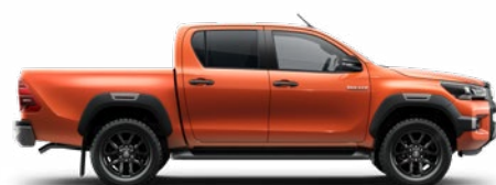
4R8 Narancsmetál Metálfényezés nettó 255 000 Ft bruttó 323 850 Ft