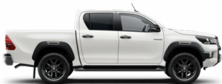
040 Hófehér Alapfényezés felár nélkül