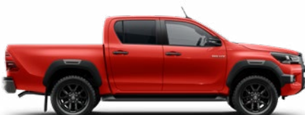
3E5 Chilipiros Metálfényezés Felár nélkül

* Szimplakabinos változatok esetén nem érhető el.