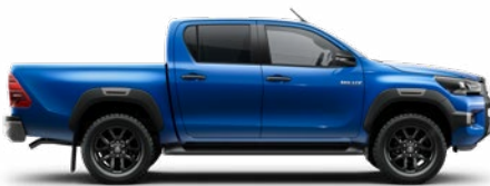
8X2 Vízkék Metálfényezés nettó 255 000 Ft bruttó 323 850 Ft