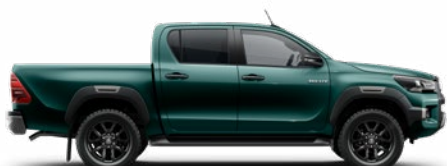
6S3 Oáziszöld Metálfényezés Felár nélkül