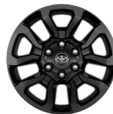
18" fekete könnyűfém keréktárcsa (5 küllős) Alapfelszereltség az Invincible modellváltozaton