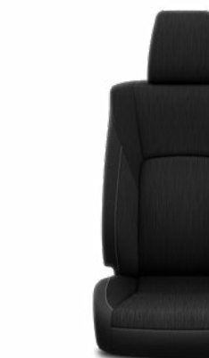
Függőleges mintázatú fekete szövet Alapfelszereltség az Active és Executive modellváltozaton