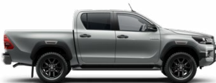
1D6 Ezüstmetál Metálfényezés nettó 255 000 Ft bruttó 323 850 Ft