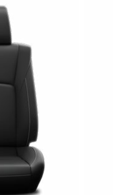
Kéttónusú perforált bőr Alapfelszereltség az Invincible modellváltozaton