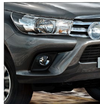
Ködlámpák 365 400 Ft