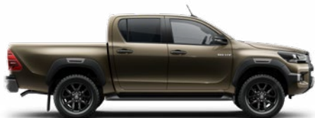
6X1 Barnászöld Metálfényezés nettó 255 000 Ft bruttó 323 850 Ft