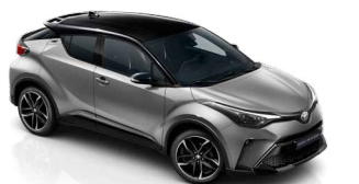
2VU Prémiumezüst / fekete tető különleges fényezés csak a GR SPORT változatban rendelhető