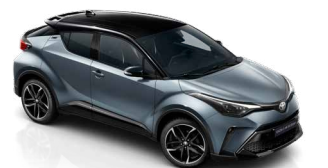
2TH Szürkéskék / fekete tető metálfényezés csak a GR SPORT változatban rendelhető