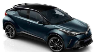
2YB Sötét zöldeskék / 785 fekete tetővel metálfényezés csak a GR Sport változatban rendelhető