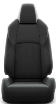
Fekete szövetkárpit, világosszürke varrással Széria a Comfort modellváltozaton