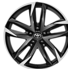
19" GR SPORT könnyűfém keréktárcsa (10 dupla küllős) Széria a GR SPORT modellváltozaton