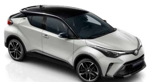
2VF Nikkelszürke / fekete tető metálfényezés csak a GR SPORT változatban rendelhető