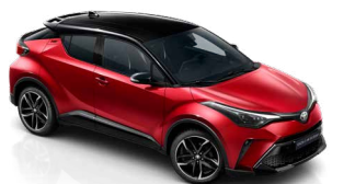
2TB Érzéki vörös / fekete tető különleges fényezés csak a GR SPORT változatban rendelhető