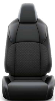
Fekete & sötétszürke szövet ülésborítás bőr betétekkel Széria a Style modellváltozaton