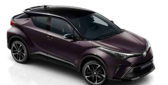
2XE Mély ametisztlila / fekete tető metálfényezés csak a GR SPORT változatban rendelhető