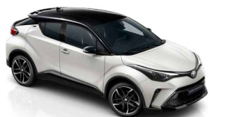
2VP Platina gyöngyfehér / fekete tető gyöngyház fényezés csak a GR SPORT változatban rendelhető