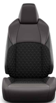
Orchidea-mintás steppelt szövetkárpit, bőr betétekkel Széria az Executive modellváltozaton