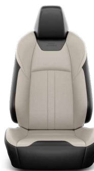
Grézs színű bőr kárpit Széria az Executive VIP modellváltozaton