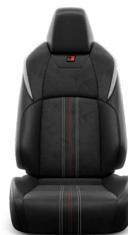
Fekete Alcantara kárpit, bőr betétekkel, szaténkróm színű díszsíkkal Széria a GR SPORT modellváltozaton