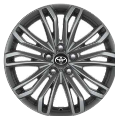
18" ezüst színű könnyűfém keréktárcsa (10 dupla küllős) Széria az Executive modellváltozaton