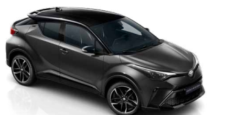
2NB Hamuszürke / fekete tető metálfényezés csak a GR SPORT változatban rendelhető