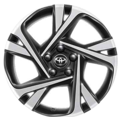
18" fekete, csiszolt hatású könnyűfém keréktárcsa (5 dupla küllős) Széria a Style modellváltozatokon