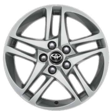
17" ezüstszerű könnyűfém keréktárcsa (5 dupla küllős) Széria a Comfort modellváltozaton