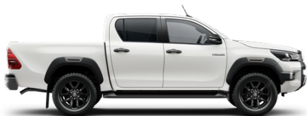
040 Hófehér Alapfényezés felár nélkül