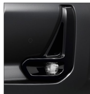
Ködlámpák 376 000 Ft