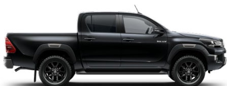
218 Fekete gyöngyház Metálfényezés nettó 255 000 Ft bruttó 323 850 Ft