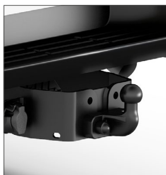
Peremre rögzített vonóhorog Vonóhorog szett 7 pólusú kábellel 300 000 Ft (márkakereskedői szerelés)