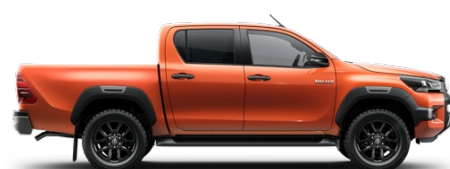
4R8 Narancsmetál Metálfényezés nettó 255 000 Ft bruttó 323 850 Ft