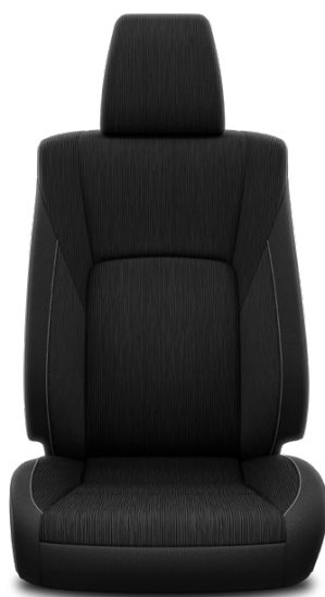
Függőleges mintázatú fekete szövet Alapfelszereltség az Active modellváltozaton