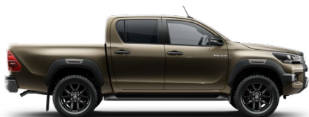
6X1 Barnászöld Metálfényezés nettó 255 000 Ft bruttó 323 850 Ft