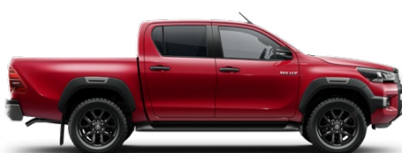
3T6 Lávavörös Metálfényezés nettó 255 000 Ft bruttó 323 850 Ft