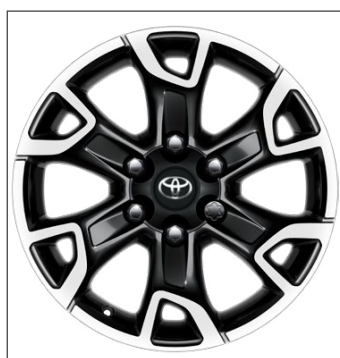
18" fekete, csiszolt hatású könnyűfém keréktárcsák 452 800 Ft