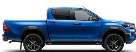
8X2 Vízkék Metálfényezés nettó 255 000 Ft bruttó 323 850 Ft