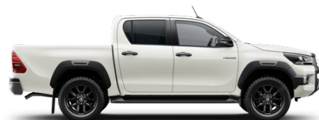
089 Gyöngyfehér* Metálfényezés nettó 310 000 Ft bruttó 393 700 Ft