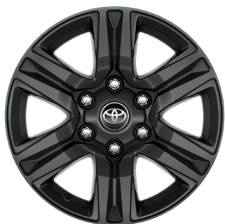
17" sötétszürke könnyűfém keréktárcsa (6 küllős) Alapfelszereltség az Active modellváltozaton