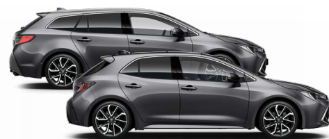
1G3 Szürke metál* 200000 Ft Elérhető az Active, Comfort és Executive felszereltségeknél