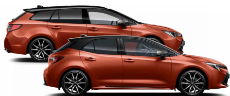
M42 GR SPORT Láva vörös / Fekete tető Elérhető a GR SPORT felszereltségen

* Metálfényezés. ** Gyöngyház fényezés. o A készlet erejéig