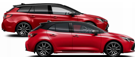
2SZ GR SPORT Passion / Fekete tető Elérhető a GR SPORT felszereltségen