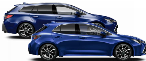
8Y8 Boróka metál* 200000 Ft Elérhető az Active, Comfort és Executive felszereltségeknél