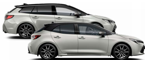
2RZ GR SPORT Nikkelszürke / Fekete tető Elérhető a GR SPORT felszereltségen