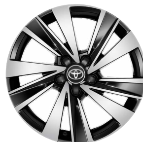
17" könnyűfém keréktárcsák 225/45 R17 gumiabronccsal Alapfelszereltség: Comfort Style