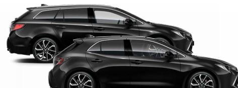
209 Éjfekete* 200000 Ft Elérhető az Active, Comfort és Executive felszereltségeknél