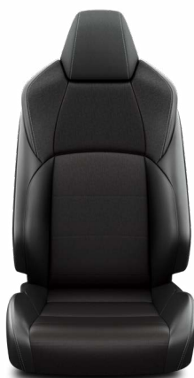
Fekete szövet ülésborítás steppelt fekete betétekkel Alapfelszereltség a Comfort és Comfort Tech felszereltségnél