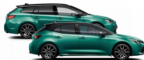
M28 Racing green / Fekete tető Elérhető a GR SPORT felszereltségen