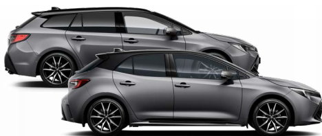
2MB GR SPORT Szürke metál / Fekete tető Elérhető a GR SPORT felszereltségen