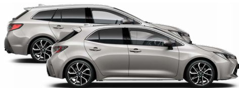
1J6 Krómezüst o 300000 Ft Elérhető az Active, Comfort és Executive felszereltségeknél