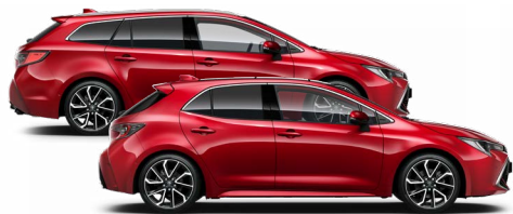
3U5 Érzéki vörös* 300000 Ft Elérhető az Active, Comfort és Executive felszereltségeknél