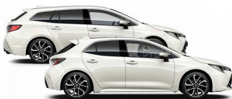
089 Platina gyöngy 300000 Ft Elérhető az Active, Comfort és Executive felszereltségeknél