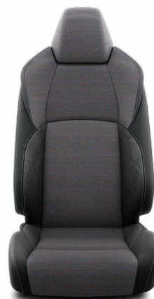
Fekete szövet ülésborítás steppelt fekete betétekkel Alapfelszereltség a Comfort Style Tech felszereltségnél