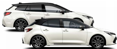
2PU GR SPORT Platina fehér / Fekete tető Elérhető a GR SPORT felszereltségen