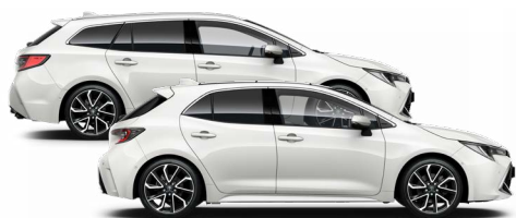
040 Hófehér felár nélkül Elérhető az Active, Comfort és Executive felszereltségeknél