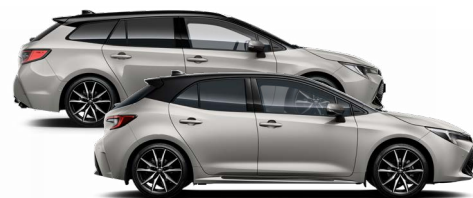
2RD GR SPORT Krómezüst / Fekete tető Elérhető a GR SPORT felszereltségen