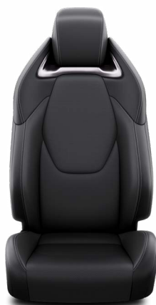
Fekete szövet ülésborítás bőr részekkel és steppelt betétekkel, bézs varrassal Alapfelszereltség az Executive felszereltségnél