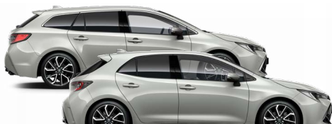
1K6 Nikkelszürke 300000 Ft Elérhető az Active, Comfort és Executive felszereltségeknél