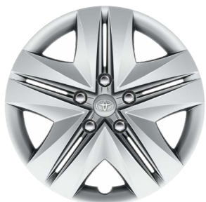
16" acél keréktárcsák 205/55 R16 gumiabroncsok dísz tárcsával Alapfelszereltség: Active