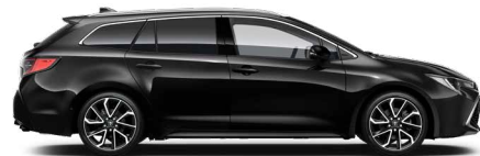
209 Éjfekete* 200 000 Ft