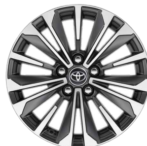
17" könnyűfém keréktárcsák 225/45 R17 gumiabronccsal Alapfelszereltség: Style