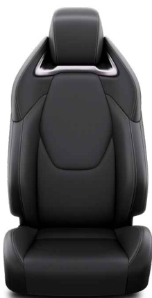
Bőr ülésborítás, fekete Alapfelszereltség az Executive és Hybrid Executive felszereltségnél