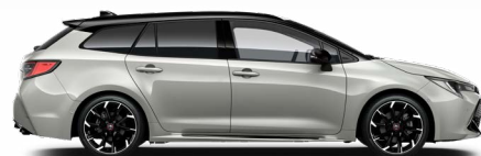
2RZ GR SPORT Higanyzürke/ Fekete tető Elérhető a GR SPORT felszereltségeken