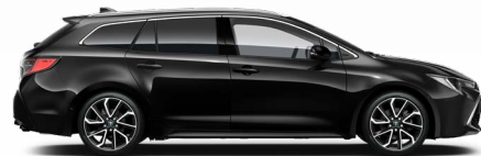
209 Éjfekete* 200 000 Ft