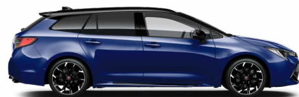
2VL GR SPORT Boróka metál/ Fekete tető Elérhető a GR SPORT felszereltségeken