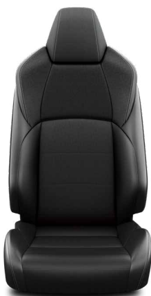
Fekete szövet ülésborítás steppelt fekete betétekkel Alapfelszereltség a Comfort, Comfort Tech és Comfort Style Tech felszereltségnél