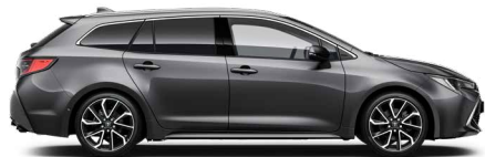
1G3 Szürke metál* 200 000 Ft