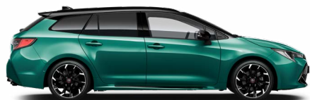
M28 Racing green / Fekete tető különleges fényezés Elérhető a GR SPORT felszereltségeken