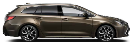
6X1 Barnászöld** 200 000 Ft