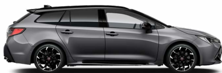
2MB GR SPORT Szürke metál/ Fekete tető Elérhető a GR SPORT felszereltségeken