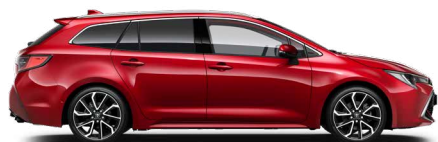
3U5 Érzéki vörös* 300 000 Ft