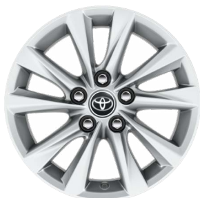
16" könnyűfém keréktárcsák 205/55 R16 gumiabronccsal Alapfelszereltség: Comfort és Comfort + Tech