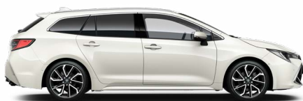
089 Platina gyöngy 300 000 Ft