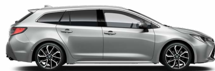
1L0 Palladium ezüst* 200 000 Ft