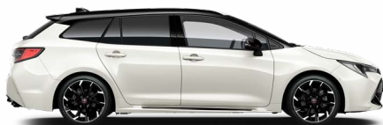
2PU GR SPORT Fehér/ Fekete tető Elérhető a GR SPORT felszereltségeken