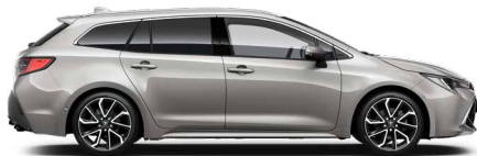
1J6 Krómezüst o 300 000 Ft