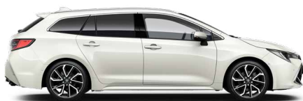
089 Platina gyöngy 300 000 Ft