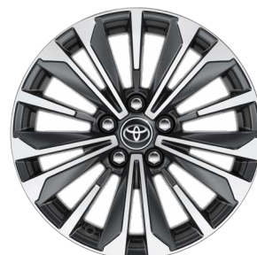
17" könnyűfém keréktárcsák 225/45 R17 gumiabronccsal Alapfelszereltség: Style