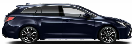
8X8 Sötétkék mica* 200 000 Ft