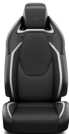
Sötétszürke szövet és szintetikus bőr ülésborítás GR Sport logoval Alapfelszereltség a GR Sport és GR SPORT Dynamic felszereltségnél