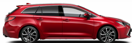
3U5 Érzéki vörös* 300 000 Ft