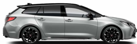
2TX GR SPORT Prémium ezüst/ Fekete tető Elérhető a GR SPORT felszereltségeken