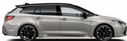
2RD GR SPORT Krómezüst/ Fekete tető Elérhető a GR SPORT felszereltségeken