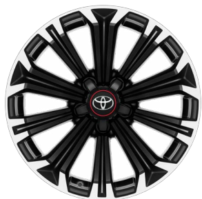
17" könnyűfém keréktárcsák 225/45 R17 gumiabroncsok Alapfelszereltség: GR SPORT