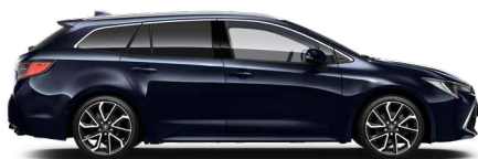
8X8 Sötétkék mica* 200 000 Ft