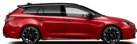
2SZ GR SPORT Passion/ Fekete tető Elérhető a GR SPORT felszereltségeken