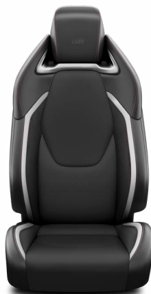
Sötétszürke szövet és szintetikus bőr ülésborítás GR Sport logoval Alapfelszereltség a GR Sport és GR SPORT Dynamic felszereltségnél