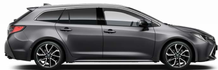
1G3 Szürke metál* 200 000 Ft