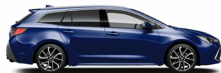
8Y8 Boróka metál* 200 000 Ft