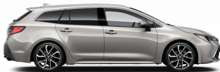
1J6 Krómezüst o 300 000 Ft