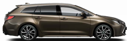
6X1 Barnászöld** 200 000 Ft