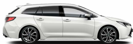
040 Hófehér felár nélkül