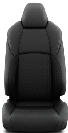
Fekete szövet ülésborítás Alapfelszereltség az Active felszereltségnél