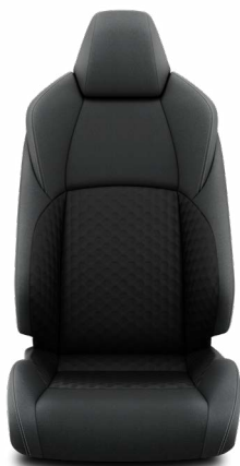
Fekete szövet ülésborítás Alapfelszereltség az Active felszereltségnél