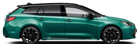
M28 Racing green / Fekete tető különleges fényezés Elérhető a GR SPORT felszereltségeken