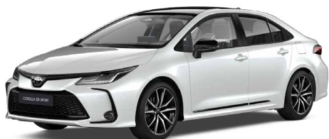
2VP GR-S gyöngyfehér felár nélkül – GR SPORT