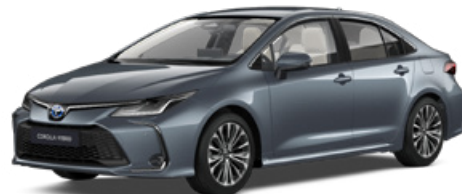
1K3 Szürkékék metál* 200 000 Ft