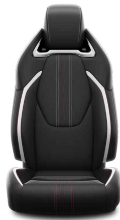
Sötétszürke szövet és szintetikus bőr ülésborítás GR SPORT logoval Alapfelszereltség a GR SPORT és GR SPORT Dynamic felszereltségnél