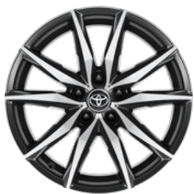
18" csiszolt hatású könnyűfém keréktárcsák (10 küllős) Alapfelszereltség a GR SPORT Dynamic felszereltségnél