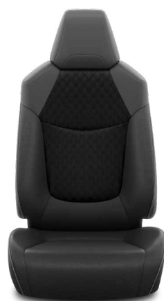
Fekete szövet ülésborítás steppelt fekete betétekkel Alapfelszereltség a Comfort, Comfort Tech és Comfort Style Tech felszereltségnél