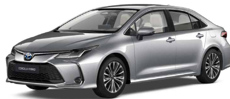
1L0 Palladium ezüst* 200 000 Ft