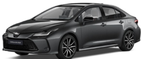
2NB GR-S szürke metál felár nélkül – GR SPORT