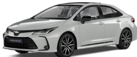
2VF GR-S hamuszürke felár nélkül – GR SPORT