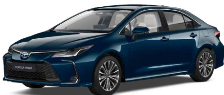
785 Tealevél mély zöld* 300 000 Ft