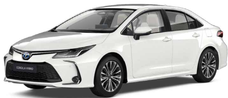
040 Hófehér felár nélkül