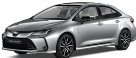
2VU GR-S prémium ezüst felár nélkül – GR SPORT