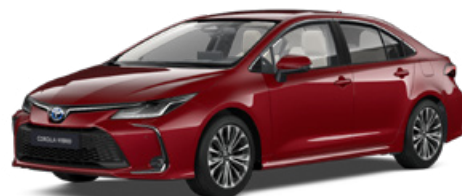
3U5 Érzéki vörös* 300 000 Ft