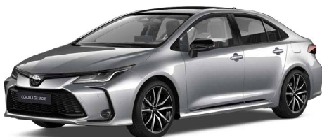
2VU GR-S prémium ezüst felár nélkül – GR SPORT