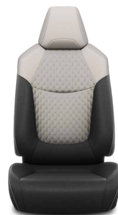
Szürke szövet ülésborítás steppelt világosszürke betétekkel Alapfelszereltség a Comfort, Comfort Tech és Comfort Style Tech felszereltségnél