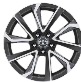
18" kéttónusú, szürke, csiszolt hatású könnyűfém keréktárcsák (5 dupla küllős) Executive Navi szereltségnél széria.