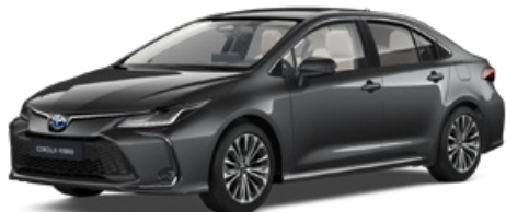
1G3 Szürke metál 200 000 Ft