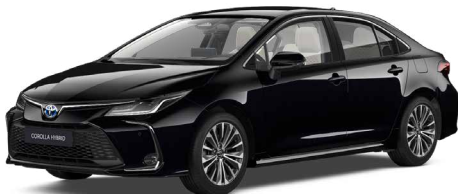
209 Éjfékete* 200 000 Ft