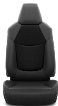
Fekete szövet ülésborítás steppelt fekete betétekkel Alapfelszereltség a Comfort, Comfort Tech és Comfort Style Tech felszereltségnél