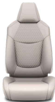
Világosszürke szövet ülésborítás bőr részekkel és steppelt szürke betétekkel, szürke varrással Alapfelszereltség Hybrid Executive felszereltségnél