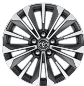
17" kéttónusú fekete, csiszolt hatású könnyűfém keréktárcsák Alapfelszereltség a Comfort Style, Hybrid Comfort Style felszereltségnél