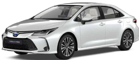
089 Platina gyöngyfehér** 300 000 Ft