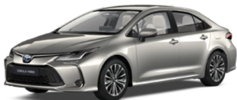
1J6 Krómezüst* 300 000 Ft