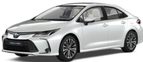
089 Platina gyöngyfehér** 300 000 Ft