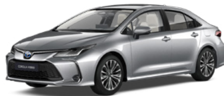
1L0 Palladium ezüst* 200 000 Ft