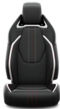
Sötétszürke szövet és szintetikus bőr ülésborítás GR SPORT logoval Alapfelszereltség a GR SPORT és GR SPORT Dynamic felszereltségnél