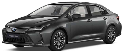
1G3 Szürke metál 200 000 Ft