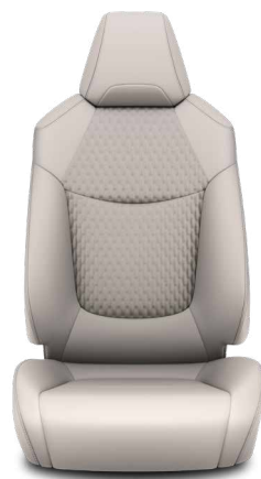
Világosszürke szövet ülésborítás bőr részekkel és steppelt szürke betétekkel, szürke varrással Alapfelszereltség Hybrid Executive felszereltségnél