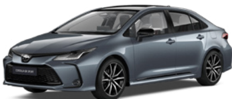
2TH GR-S szürkékék felár nélkül – GR SPORT