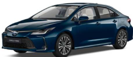
785 Tealevél mély zöld* 300 000 Ft