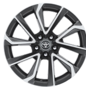
18" kéttónusú, szürke, csiszolt hatású könnyűfém keréktárcsák (5 dupla küllős) Executive Navi szereltségnél széria.