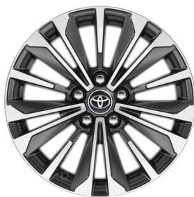
17" kéttónusú fekete, csiszolt hatású könnyűfém keréktárcsák Alapfelszereltség a Comfort Style, Hybrid Comfort Style felszereltségnél