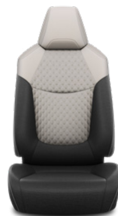
Szürke szövet ülésborítás steppelt világosszürke betétekkel Alapfelszereltség a Comfort, Comfort Tech és Comfort Style Tech felszereltségnél