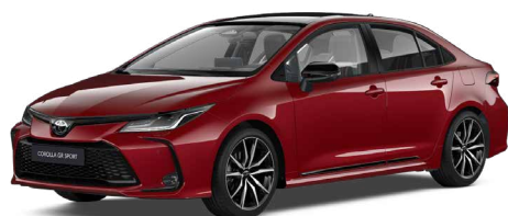
2TB GR-S érzéki vörös felár nélkül – GR SPORT