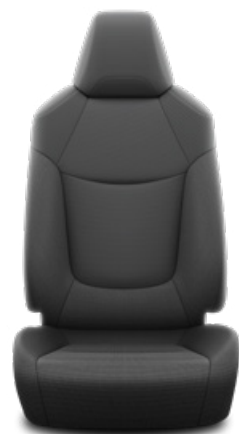
Fekete szövet ülésborítás Alapfelszereltség az Active felszereltségnél