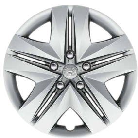
15" acél keréktárcsák díztárcsával (8 küllős) Alapfelszereltség az Active, Hybrid Active felszereltségnél