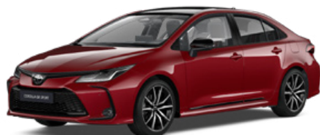
2TB GR-S érzéki vörös felár nélkül – GR SPORT