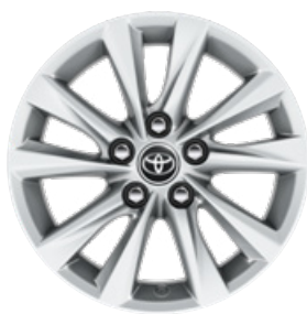
16" könnyűfém keréktárcsák (5 duplaküllős) Alapfelszereltség a Comfort és Hybrid Comfort felszereltségnél