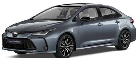
2TH GR-S szürkéskék felár nélkül – GR SPORT