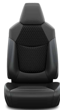
Fekete szövet ülésborítás bőr részekkel és steppelt betétekkel, bézs varrással Alapfelszereltség Hybrid Executive felszereltségnél