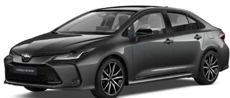
2NB GR-S szürke metál felár nélkül – GR SPORT