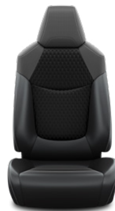
Fekete szövet ülésborítás bőr részekkel és steppelt betétekkel, bézs varrással Alapfelszereltség Hybrid Executive felszereltségnél