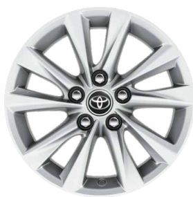
16" könnyűfém keréktárcsák (5 duplaküllős) Alapfelszereltség a Comfort és Hybrid Comfort felszereltségnél