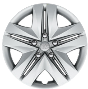
15" acél keréktárcsák díztárcsával (8 küllős) Alapfelszereltség az Active, Hybrid Active felszereltségnél