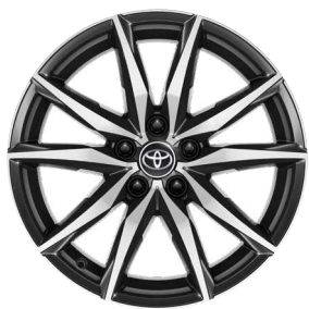
18" csiszolt hatású könnyűfém keréktárcsák (10 küllős) Alapfelszereltség a GR SPORT Dynamic felszereltségnél