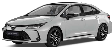
2VF GR-S hamuszürke felár nélkül – GR SPORT