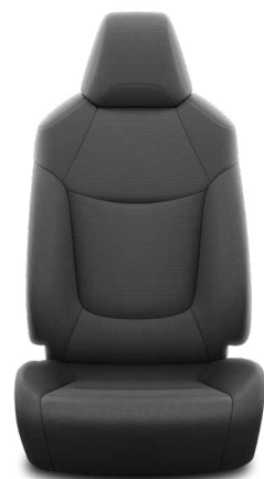
Fekete szövet ülésborítás Alapfelszereltség az Active felszereltségnél