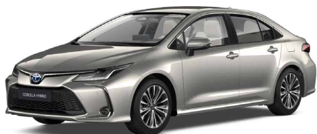
1J6 Krómezüst* 300 000 Ft