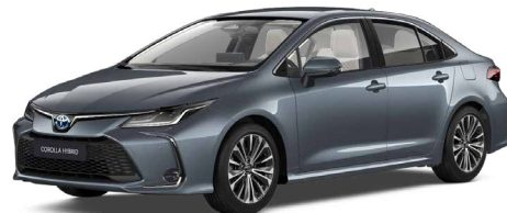
1K3 Szürkéskék metál* 200 000 Ft