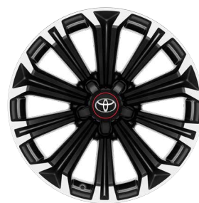
17" GR SPORT könnyűfém keréktárcsák (10 küllős) Alapfelszereltség a GR SPORT felszereltségnél