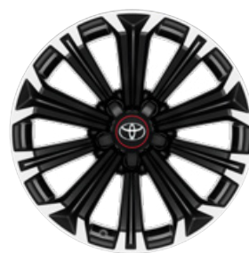
17" GR SPORT könnyűfém keréktárcsák (10 küllős) Alapfelszereltség a GR SPORT felszereltségnél