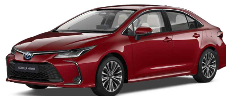
3U5 Érzéki vörös* 300 000 Ft