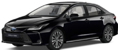
209 Éjfékete* 200 000 Ft